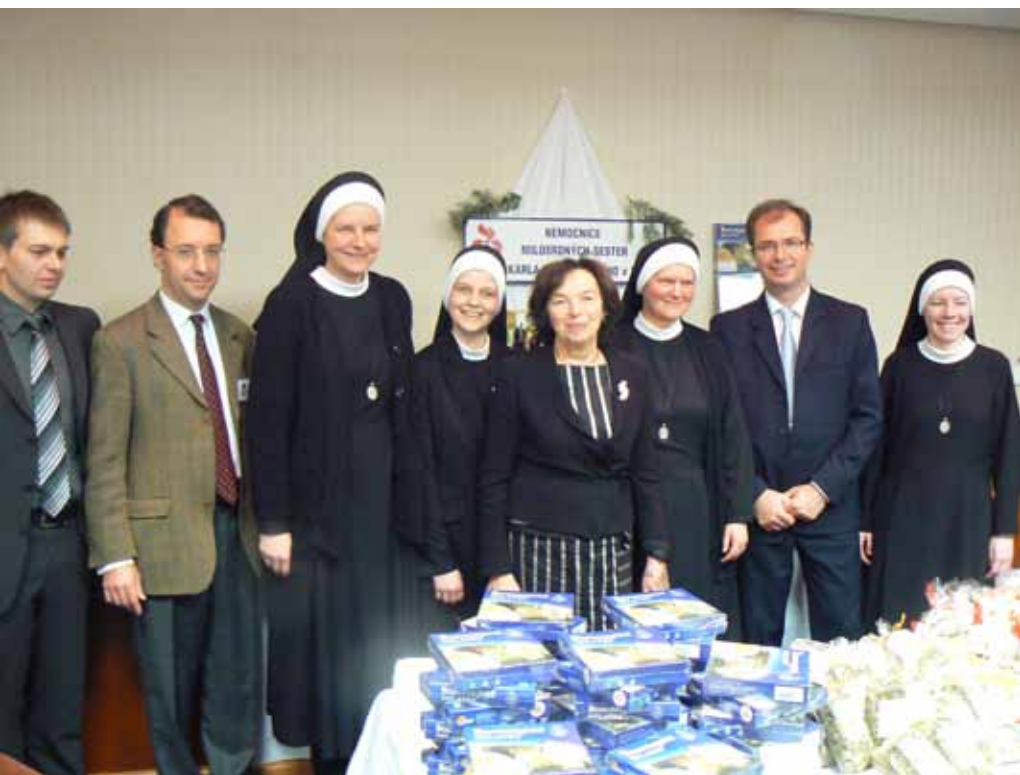
Vánoční bazar Diplomatic Spouses Association Prague v hotelu Hilton