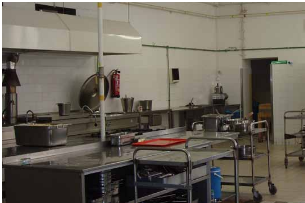
Kuchyně před rekonstrukcí (nahore) a po rekonstrukci (dole)