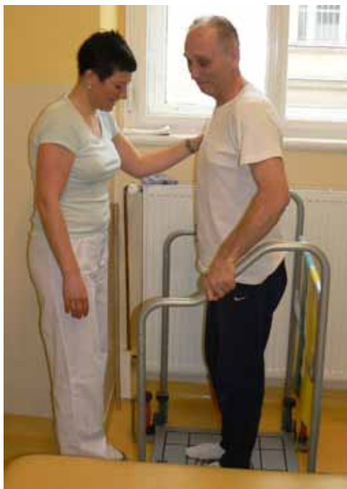
Cvičení na rehabilitaci