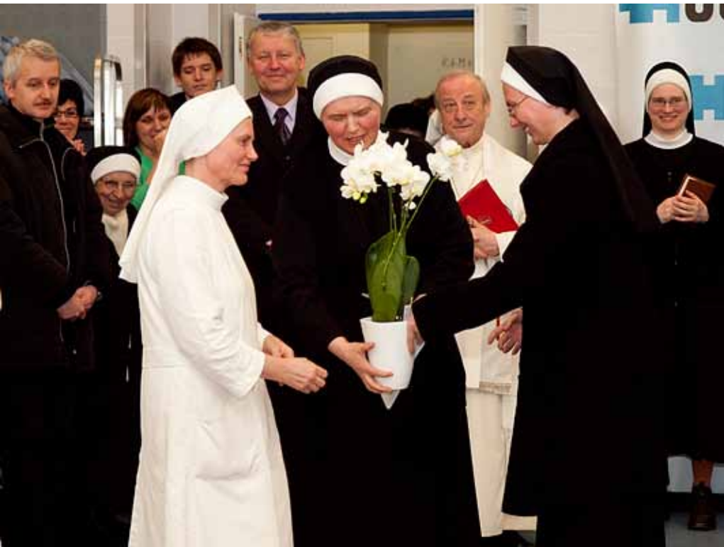
Svěcení zrekonstruované kuchyně