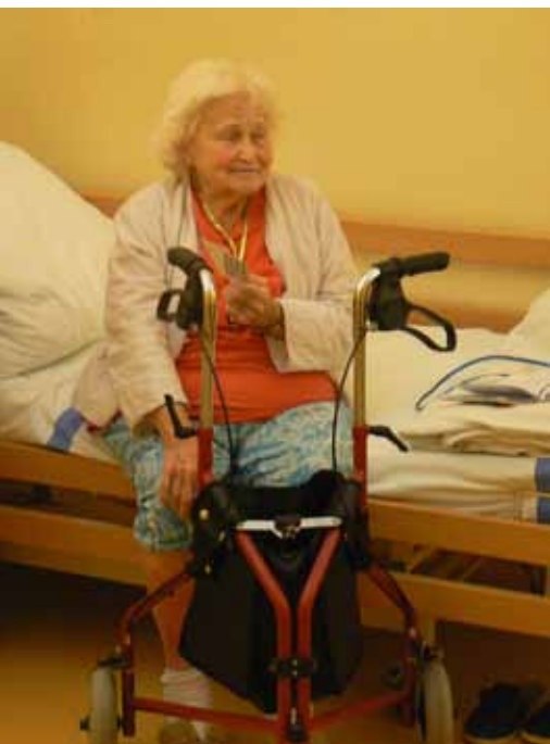
Spokojené stáří na ošetrovatelských lůžkách