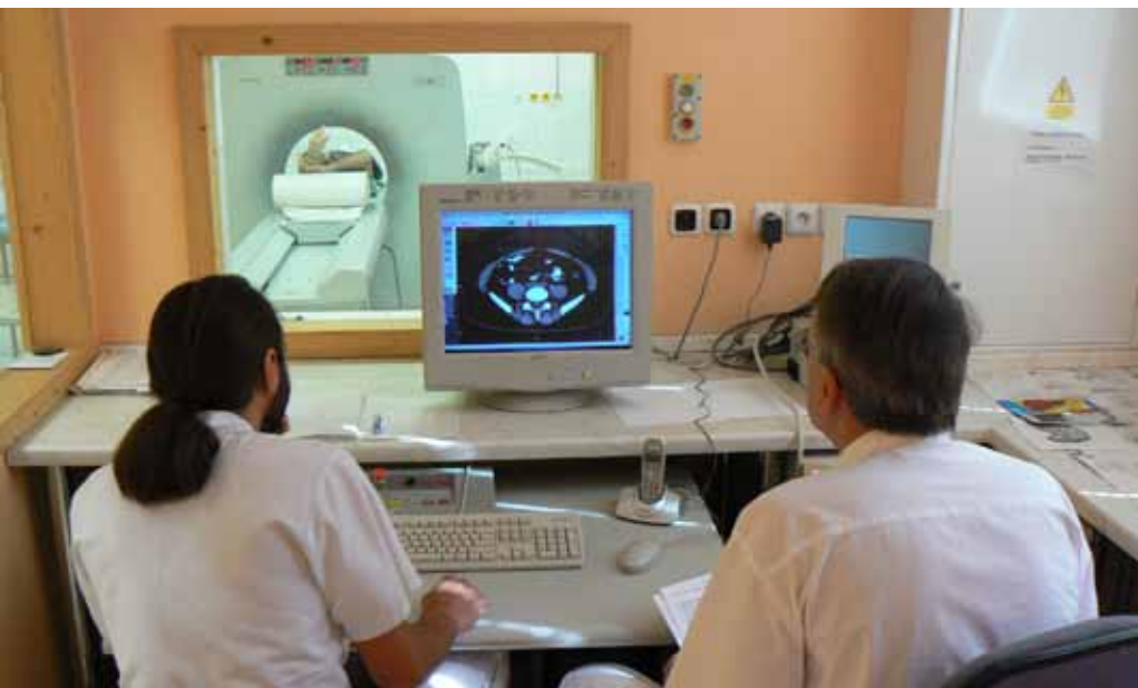
Vyšetření počítačovým tomografem